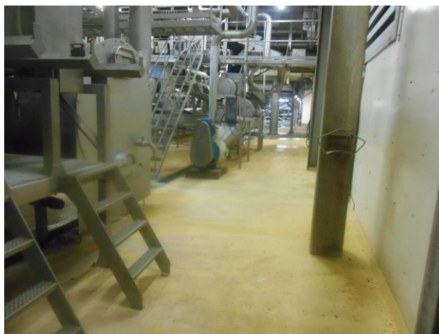
Notre référence à Oudenhorn (Les Pays-Bas): Farm Frites