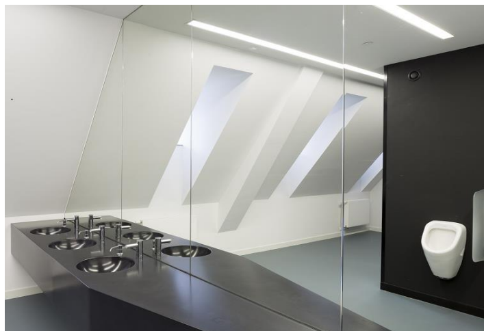
Onze referentie in Antwerpen (België): Havenhuis