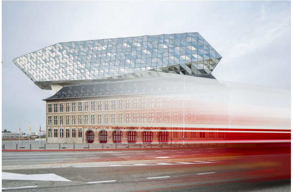
Notre référence à Anvers (Belgique): La Nouvelle Maosion de Port d'Anvers